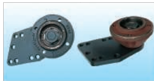
Stützwalze mit abnehmbarer Wellenlagerung

"Die in den Ländern der Europäischen Union vertriebenen Maschinen entsprechen der Europäischen Maschinen-Richtlinie; in allen übrigen Ländern entsprechen die Maschinen den jeweiligen gesetzlichen Bestimmungen. Zu einer klareren Darstellung würde ggf. manche Schutzvorrichtung abgenommen. Sie müssen sonst jedoch unter allen Umständen in Schutzstellung bleiben, gemäß den in der Montage- und Betriebsanleitung aufgeführten Sicherheitshinweisen. Änderungen an Maschinen, Ausrüstungen und Zubehör behalten wir uns vor. Die in diesem Prospekt dargestellten Maschinen und Ausrüstungen können durch mindestens ein Patent und/oder Geschmacksmuster geschützt sein. Eingetragene Marke(n)."