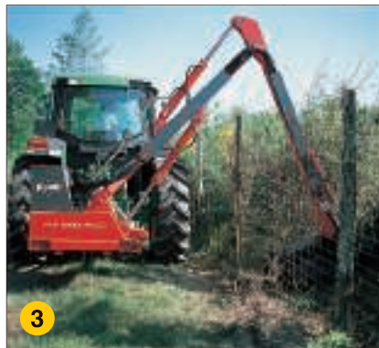
Arbeiten über Hindernisse hinweg