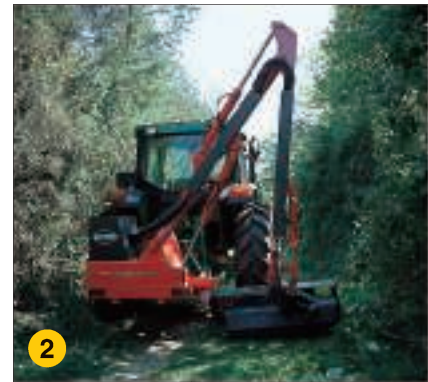
Auf schmalen Wegen