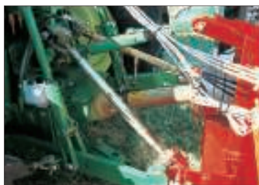
Stabilisierungsstreben für Traktorunterlenker